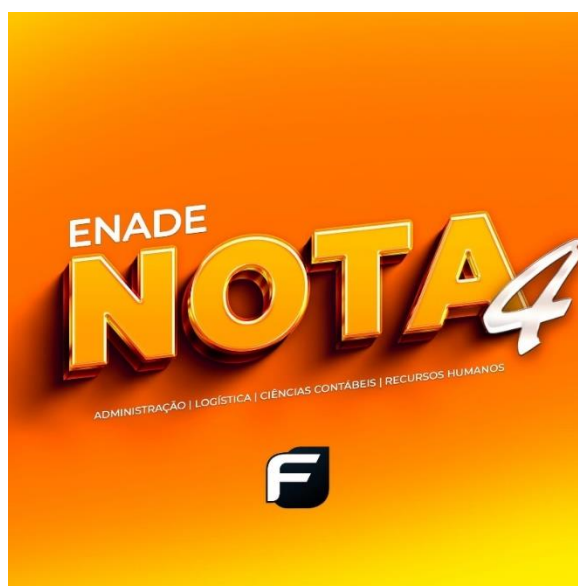
Figura 06 – Selos de Divulgação da Avaliação Externa

Em 2022 os cursos da Faculdade de Agudos que realizaram o Enade foram todos do Presencial: Administração, Ciências Contábeis, Logística e Tecnologia em Gestão de Recursos Humanos. Em outubro de 2023 a Faculdade de Agudos recebeu os resultados dos cursos Avaliados: Administração (4), Logística (4), e de Tecnologia de Gestão de Recursos Humanos (4), conforme Figura 06. Somente o curso de Ciências Contábeis não recebeu o conceito devido ao baixo número de alunos concluinte da Instituição.