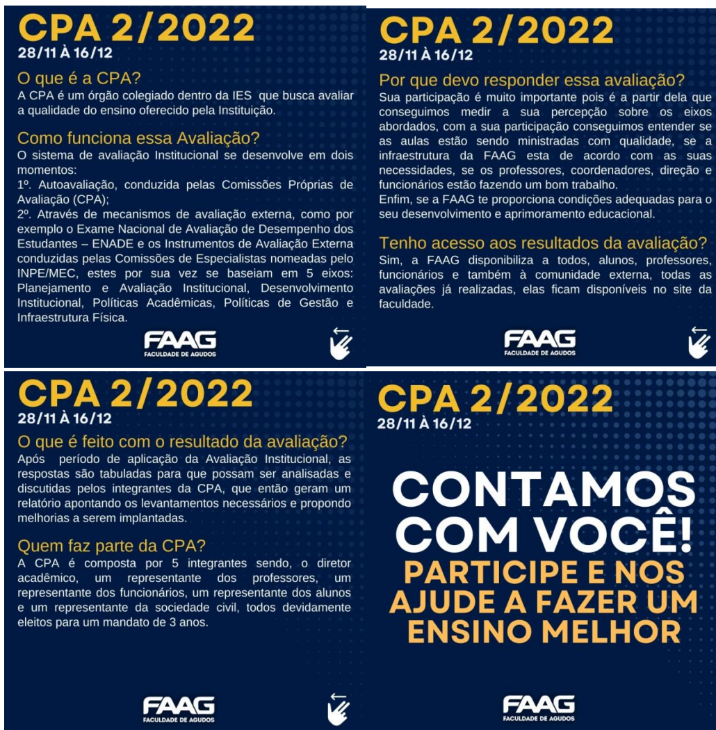
Figura 4– Peça de sensibilização Autoavaliação 2022