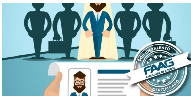
Figura 04. Banner de divulgação do Banco de Talento FAAG

O desenvolvimento do Banco de Talentos FAAG tem por premissa esse importante aspecto direcionador de nossas atividades na instituição: empregabilidade . Nesse sentido, são realizadas parcerias regionais com empresas, visando à inserção de nossos (as) alunos (as) no mercado de trabalho, seja em uma primeira oportunidade de emprego, seja recolocação profissional, seja estágio.