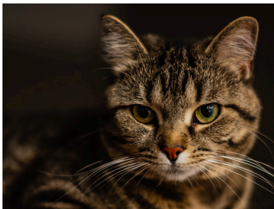
Figura 2: Gato rajado (HELVETICA, 10 PT, centralizado, espaçamento: 12 pt antes, 6 pt depois; entre linhas simples, cor cinza)

(HELVETICA, 10 PT, centralizado, espaçamento: 6 pt antes, 12 pt depois; entre linhas simples, cor cinza)